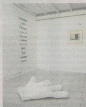
Mite, la más pequeña y arriesgada