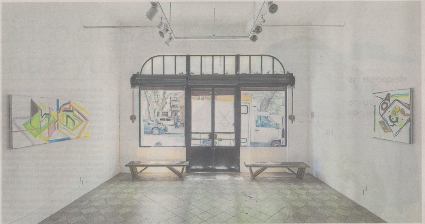
SlyZmud comenzó en 2011 sin staff propio en Villa Crespo; en diciembre participará de Art Basel Miami